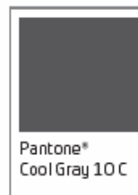
Pantone® Cool Gray 10 C