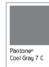
Pantone® Cool Gray 7 C