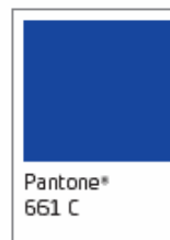
Pantone® 661 C

Cyan: 100% Magenta: 85% Yellow: 0% Black: 0%