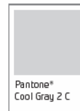
Pantone® Cool Gray 2 C